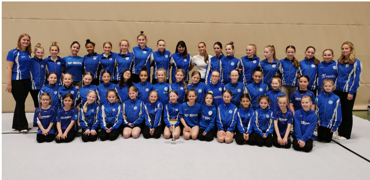
Gratulerer til Beste klubb 2024; Bergens Turnforening

Også i år vil vi kåre beste klubb! Vi gir prisen til den klubben som viser entusiasme på tribunen, mangfold i deltagelse, god oppførsel, ryddighet i garderobe og treningshall og positive RG holdninger!