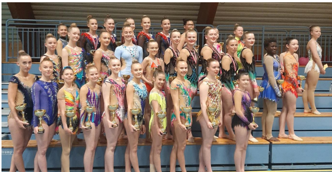
Deltakere fra Ålesund, Hødd og Sykkylven på Kretsmesterskap 2022, Arrangør: Sykkylven IL

Så nå er vi ca 151 aktive RG utøvere i Møre og Romsdal.