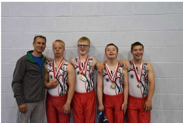
Internasjonal SO konkurranse, Falcon Spartak, London