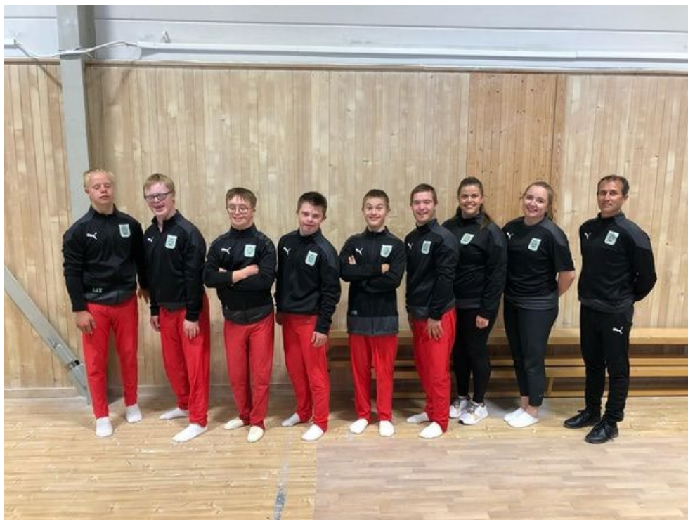
Unni & Haralds Trophy, Oslo Turnforening