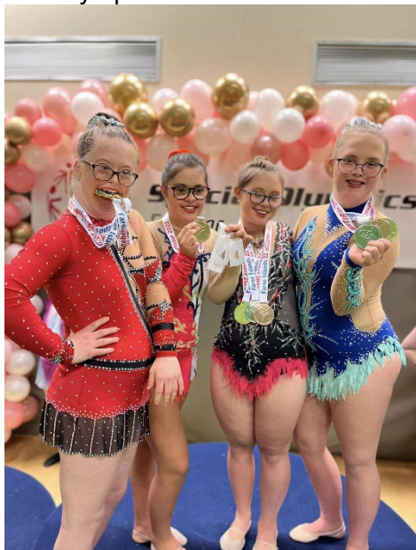
Nordisk Færøylene Genova, Italia

Paraturn Menn og Para RG er inkludert i Kretskonkurranser i tillegg til egen Nasjonal og Internasjonal deltagelse. Para bredde delta i samling, lav-terskel konkurranse og oppvisning i byfestene og egen klubber. Det må jobbes med å få Paraturn kvinner involvert i Kretskonkurranser. Kretsen har også en utøvere med fysisk funksjonshemming som har deltatt i Internasjonal konkurranse i Wales med veldig bra resultat. Det jobbes med å få Turn i Paralympics.