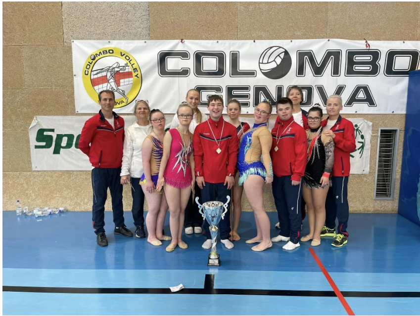
Internasjonal SO konkurranse, Genova, Italia