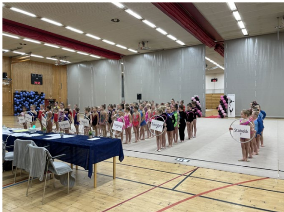
Første pulje MiniRekrutter