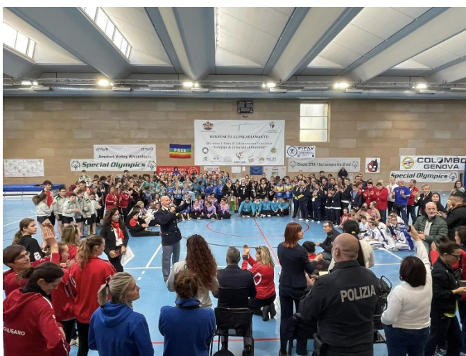
Internasjonal SO konkurranse,