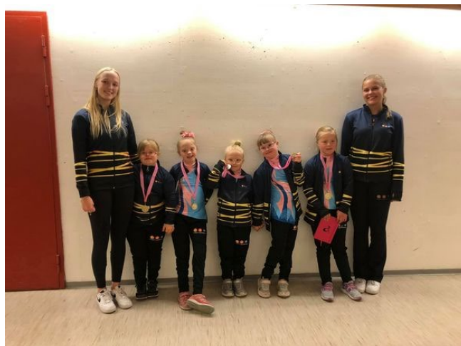
Vår minste Paraturn utøvere MiniRekrutt, Kretskonkurranse Kolbotn og GRGD, Asker