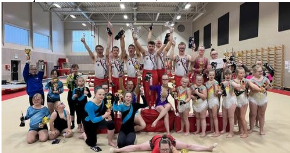
Nasjonal konkurranse, Kjennhallen